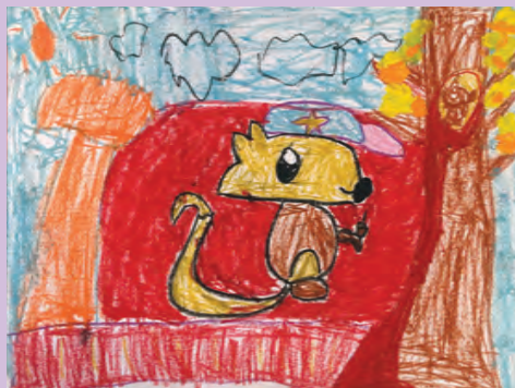
陳樂欣作品▶ 《松鼠和松鼠BB》