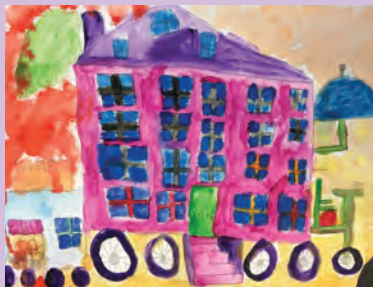
董懿萱作品《單車屋》▲